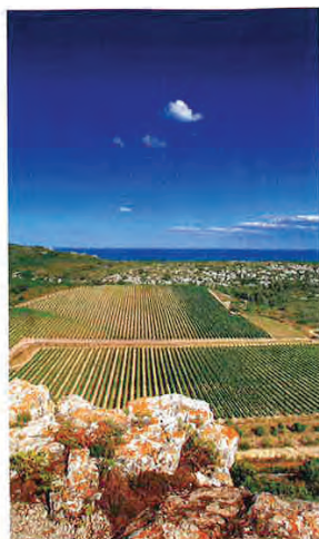
ESCAPADES EN FRANCE ▶ P.100